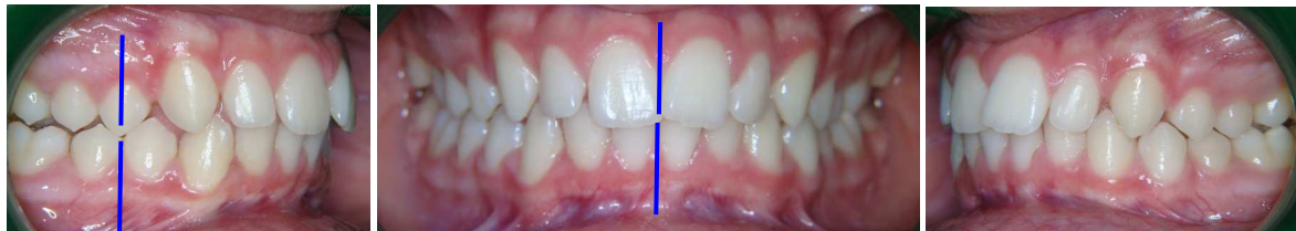
Correction de la supraclusion par égression molaire