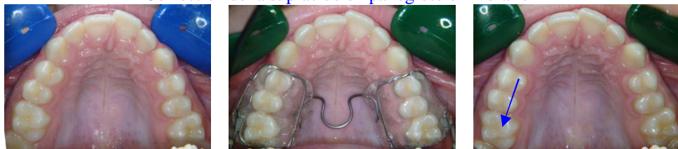
2 Options au maxillaire : Boucle Coffin ou vérin