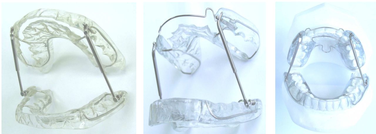
La boucle de Coffin permet une légère expansion

Classe III : 3 options de la gouttière supérieure